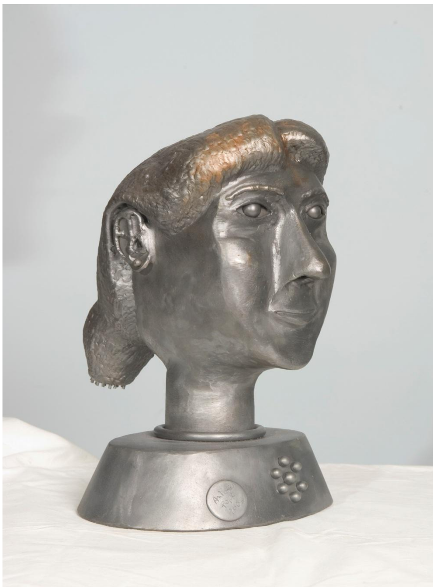
Antonio PEPE “MANDYNA”, 2004, Acciaio Assemblato e Saldato, h.= cm 38