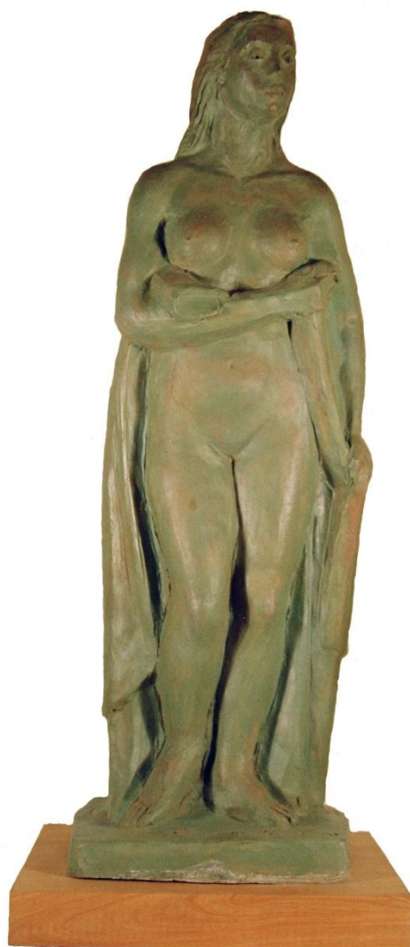
Ermonde LEONE “FIGURA FEMMINILE” 1993, Terracotta Patinata, h.= cm 50