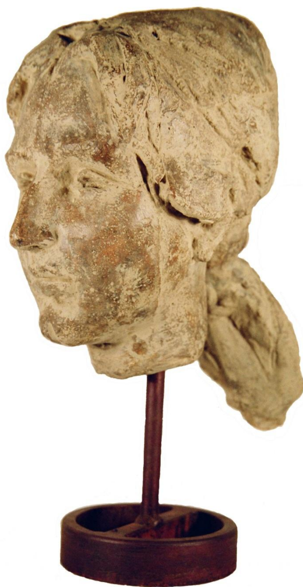
Gennaro CARRESI “RITRATTO DI RAGAZZA”, 1978, Terracotta, h = cm 45