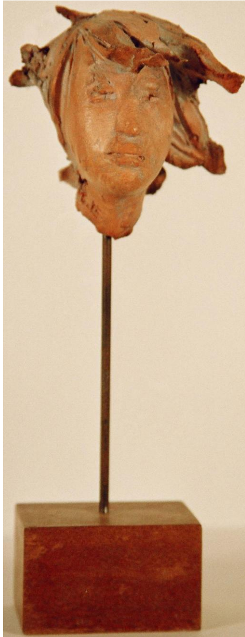
Carmelo BARILLA' "RITRATTO" 2003, Terracotta, h. = cm 9