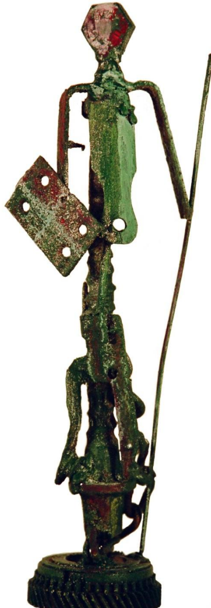
Filippo MALICE “GUERRIERO TEMPLARE”, 2005, Ferro patinato, h = cm 40